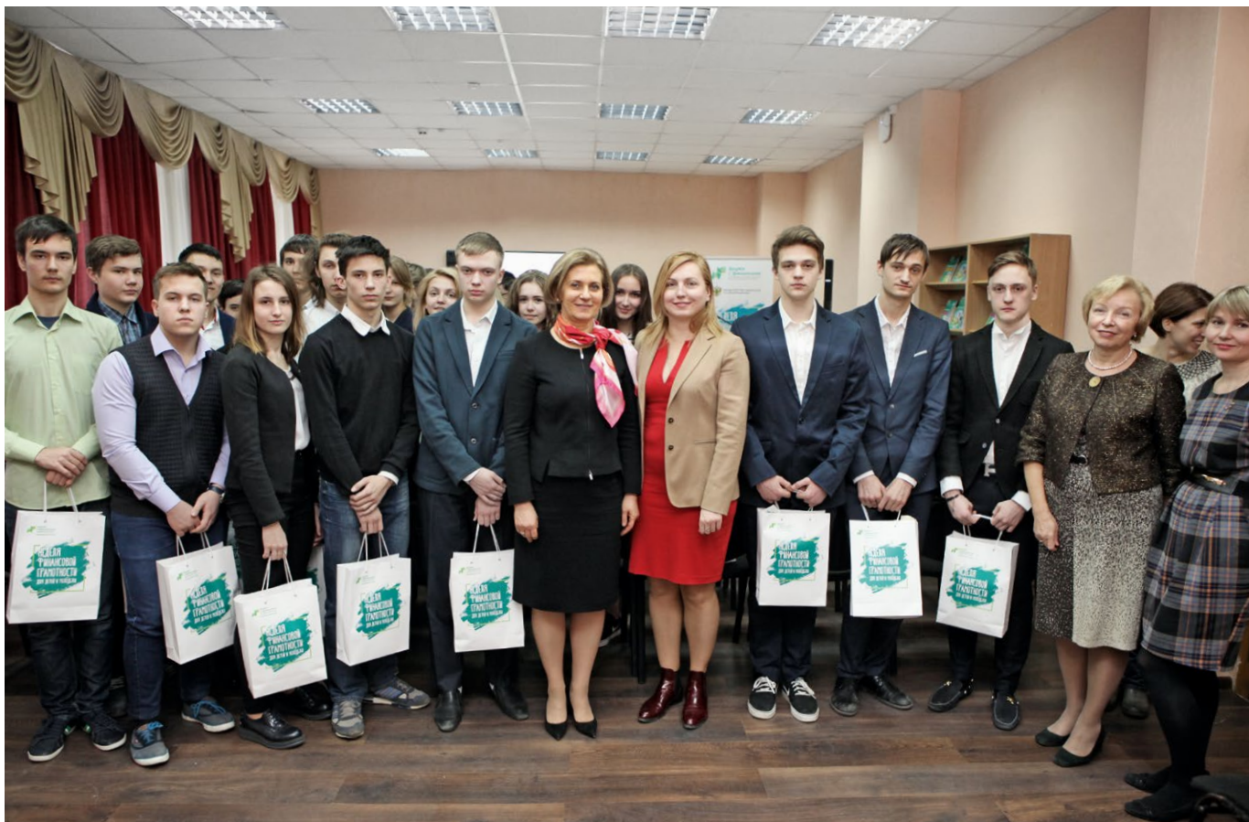
Многопрофильный лицей № 1799, структурное подразделение «Лицей Плехановец»

Для потребителей мы разработали отдельный портал — zpp.gospotrebnadzor.ru . Это вся нормативная база по защите прав потребителей, образцы исковых заявлений. Отдельного внимания заслуживают опубликованные в открытом доступе сведения о случаях нарушения требований техрегламентов с указанием конкретных фактов несоответствия продукции обязательным нормам.