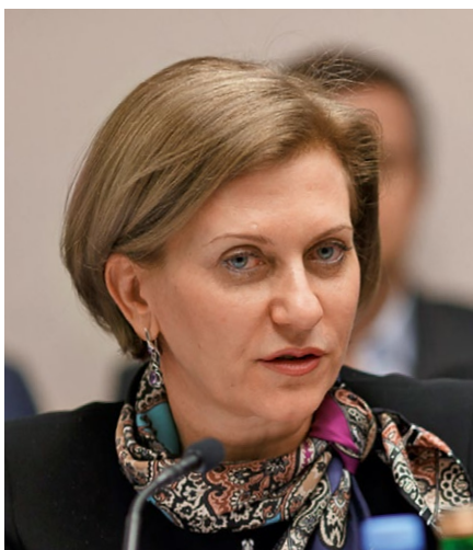
Анна Попова, руководитель Роспотребнадзора

Всемирный день защиты прав потребителей, отмечаемый 15 марта, совпал с проведением II Всероссийской недели финансовой грамотности для детей и молодежи и Всемирной недели денег — Global Money Week. В преддверии Недели о деятельности Роспотребнадзора в области защиты прав потребителей финансовых услуг и повышения финансовой грамотности граждан в интервью «Российской газете» рассказала руководитель ведомства Анна Попова.