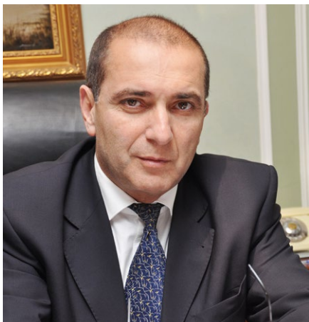
Гарегин Тосунян, президент Ассоциации российских банков (АРБ)

«Современная экономическая реальность устроена так, что в ней намного увереннее чувствует себя финансово грамотный человек. Повышение финансовой грамотности сегодня важно для всего нашего общества. Увеличение количества таких людей — залог стабильного будущего нашей страны.